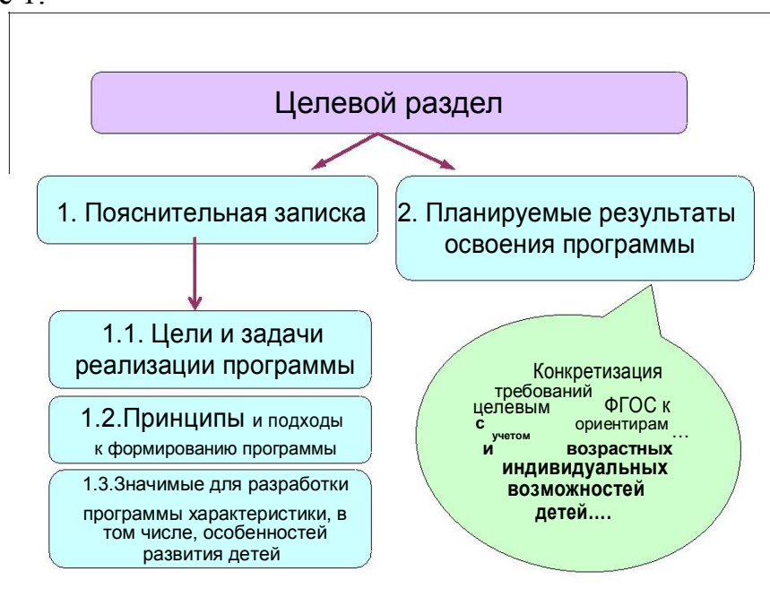
Схема 1. Структура целевого раздела Программы.

Проектирование основной образовательной программы начинается с Целевого раздела. Его структура в соответствии со Стандартом представлена на Схеме 1.